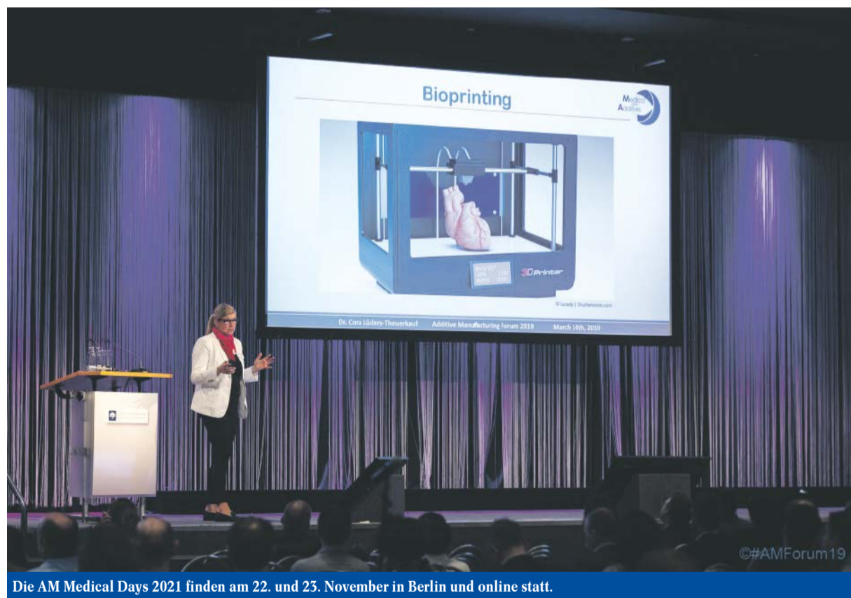
Die AM Medical Days 2021 finden am 22. und 23. November in Berlin und online statt.